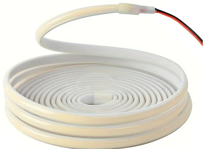
Taśma LED COB Neon 480 24V 10W 120lm/W