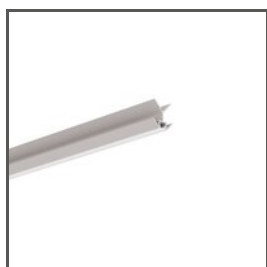
Profil PIKO-KZ A00034