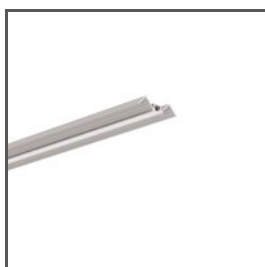
Profil PIKO-KW A00035