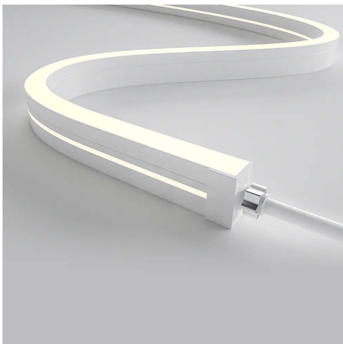
Taśma LED 2835 SMD 120 Neon Side View 12V 10W 26lm/W