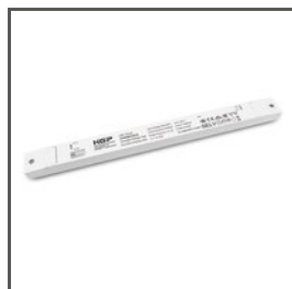
KGP LV60W24CG 24V E60507-060B-24