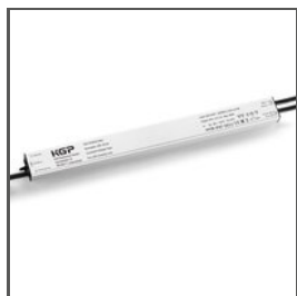
KGP XSV100W24 DALI 24V E60513-100D-24-V