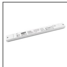
KGP LV150W24CG 24V E60515-150B-24