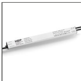
KGP XSV160W24 DALI 24V E60517-160D-24-V