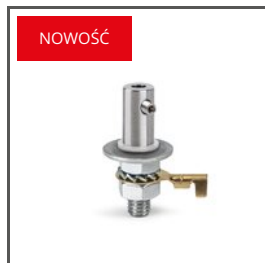
ZAWIESZKA FI-8-PRET-BOX-Z C28264