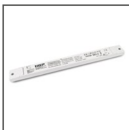
KGP LV30W24CG DALI 24V E60504-030D-24