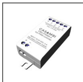
Casambi CBU-PWM4 E62148