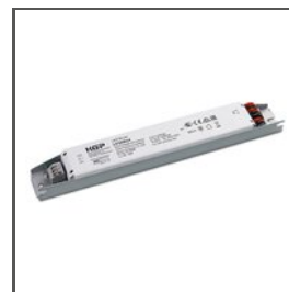
KGP LV30W24 30W 24V E60523-030B-24