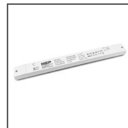
KGP LV250W24CG 24V E60519-250B-24