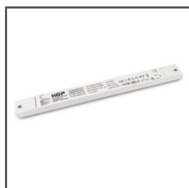
KGP LV60W24CG DALI 24V E60508-060D-24