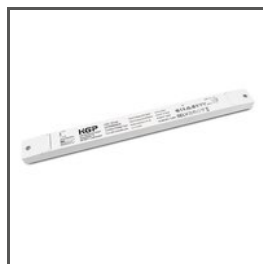
KGP LV100W24CG 24V E60511-100B-24