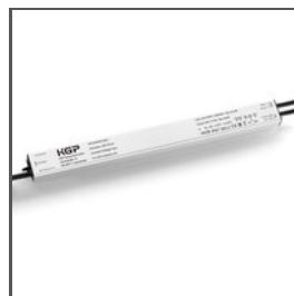
KGP XSV240W24 DALI 24V E60521-250D-24-V