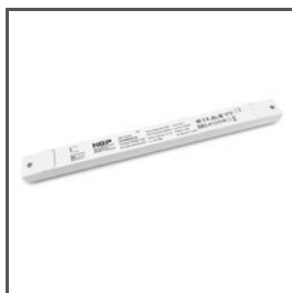
KGP LV30W24CG 24V E60503-030B-24