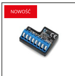
RGB+CCT, Wlightbox E60235