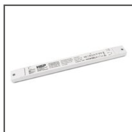
KGP LV100W24CG DALI 24V E60512-100D-24