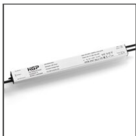
KGP XSV30W24 DALI 24V E60505-030D-24-V