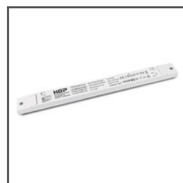
KGP LV150W24CG DALI 24V E60516-150D-24