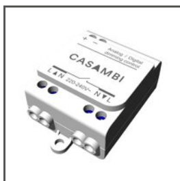
Casambi CBU-ASD E62147