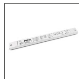
KGP LV250W24CG DALI 24V E60520-250D-24