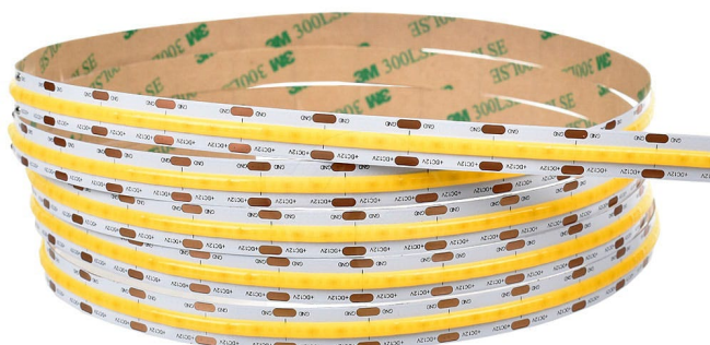
Taśma LED COB 320 24V 8W 106lm/W