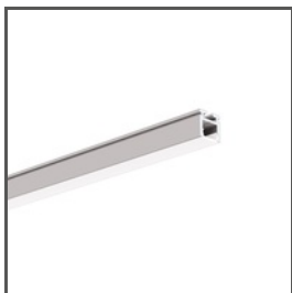
PIKO-ZM A01168 Ref. arch C1168