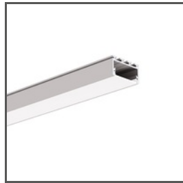
GIZA-LL A00758 Ref. arch C0758