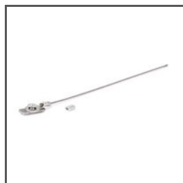
LINKA ZABEZPIEZAJĄCA ZM-2 Z70521 Ref. arch 70521