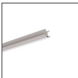
Profil PIKO-KZ A00034