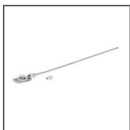
LINKA ZABEZPIEZAJĄCA ZM-2 Z70521 Ref. arch 70521