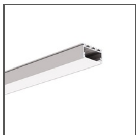
GIZA-LL A00758 Ref. arch C0758