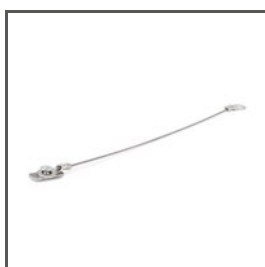
LINKA ZABEZPIEZAJĄCA ZM-1 Z70520 Ref. arch 70520