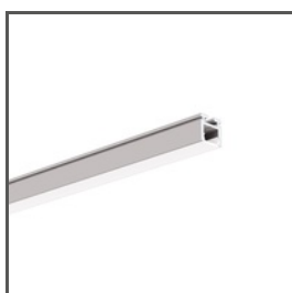
PIKO-ZM A01168 Ref. arch C1168