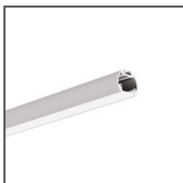
OLEK A08505 Ref. arch B8505