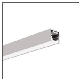
PDS-ZM-PLUS A02056 Ref. arch C2056