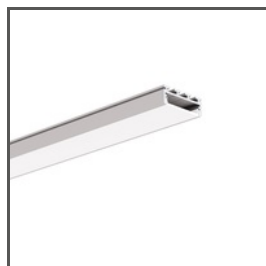
GIZA A05556 Ref. arch B5556