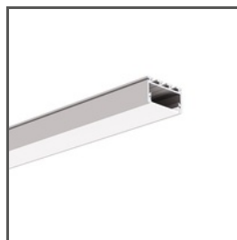
GIZA-LL A00758 Ref. arch C0758