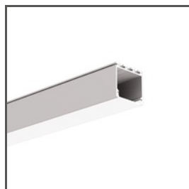
LIPOD A05554 Ref. arch B5554